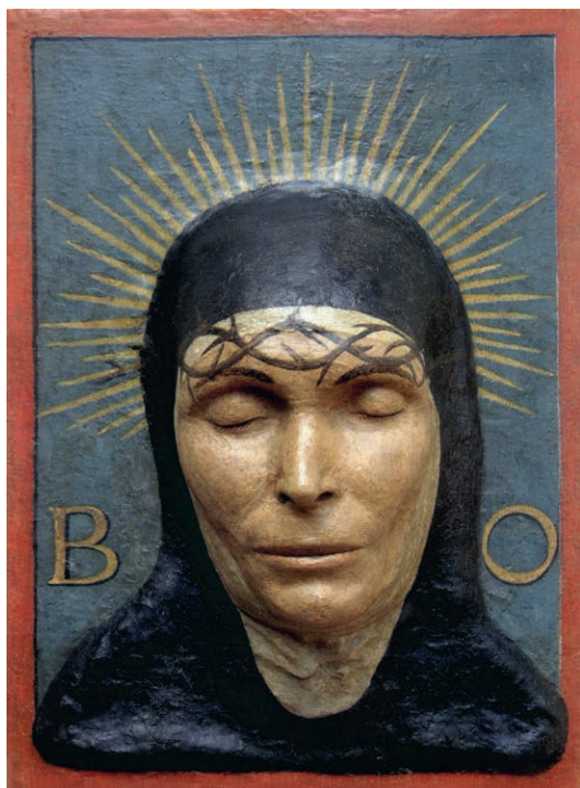
Fig.10, Casa della beata Osanna Andreasi, Mantova, maschera funebre della Beata