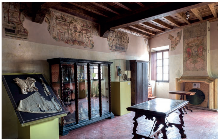
Fig.6, Casa della beata Osanna Andreasi, Mantova , stanza-museo

marito 11 . In tal caso la famiglia Magnaguti sarebbe l'artefice del primo tentativo di sistemazione degli oggetti sopravvissuti, se non proprio di una catalogazione.