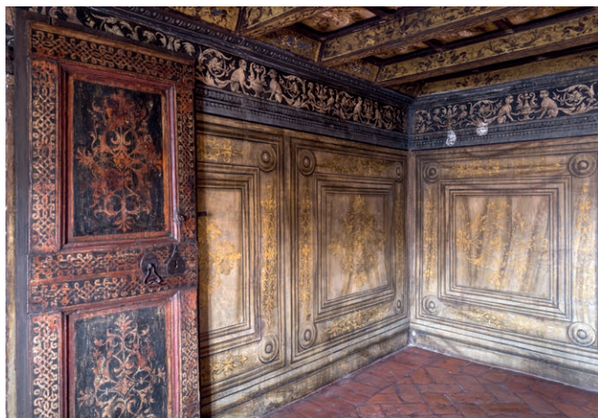
Fig.3, Casa della beata Osanna Andreasi, Mantova, studiolo

Dentro la Casa, molti ambienti conservano ancora parti del fregio cinquecentesco ad affresco, decorato a grottesche 6 . In particolare due stanze, sempre inserite nel circuito di visita, meritano di