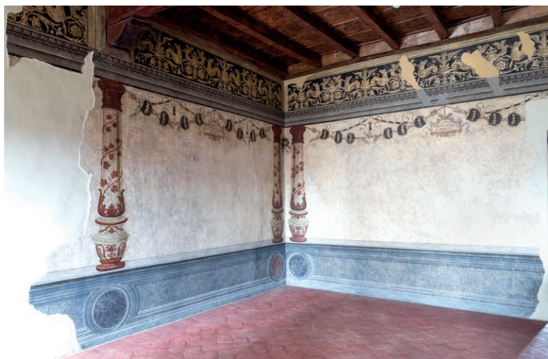
Fig.4, Casa della beata Osanna Andreasi, Mantova, stanza delle colonne

E non va dimenticato che un'eco dalle due stanze appena ricordate si rintraccia nel dipinto di Ferrara (Pinacoteca Nazionale), riconosciuto come la Morte della beata Osanna Andreasi e, con cautela, attribuito a Bernardino Bonsignori verso il 1510 7 .