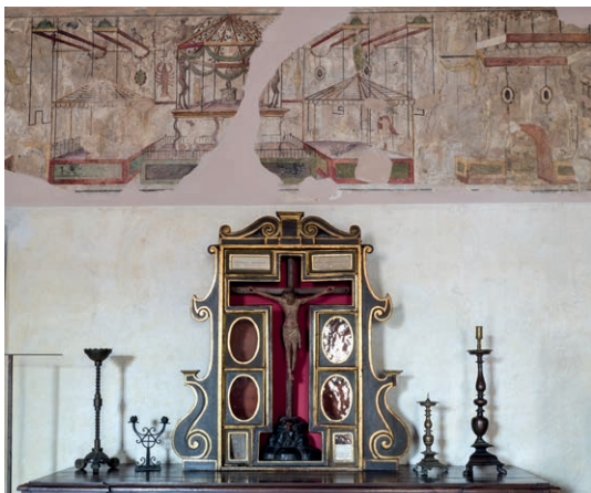
Fig.5, Casa della beata Osanna Andreasi, Mantova , reliquiario e fregio cinquecentesco a grottesche