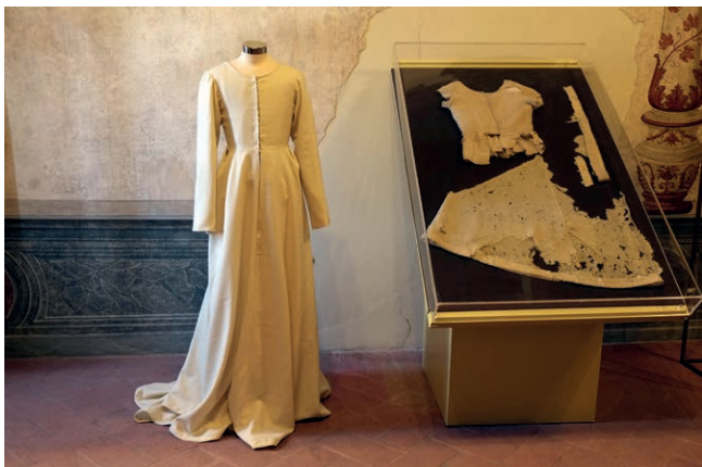
Fig. 8, Casa della beata Osanna Andreasi, Mantova, abito della Beata (l'originale frammentario e la recente ricostruzione)