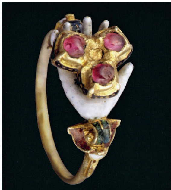
Fig.7, Casa della beata Osanna Andreasi, Mantova, anello della Beata

Un espositore è dedicato all'anello della Beata (fig.7) in oro rosso, gemme e smalti, che risale