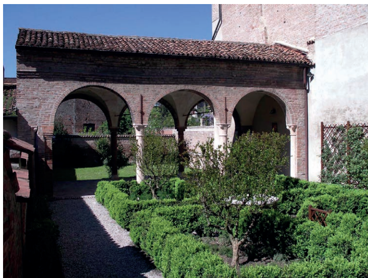
Fig.2, sopra, Casa della beata Osanna Andreasi, Mantova , portico tra il giardino e l'orto

Casa ne curò il restauro, si occupò della facciata e fece demolire le stanze tra le arcate del giardino portando in luce il portico. Si impegnò ad acquistare sul mercato antiquario le biografie antiche dedicate alla Beata, donò libri, oggetti e reliquie. Secondo le sue volontà testamentarie, la Casa fu destinata in eredità in parte alla Parrocchia di Sant'Egidio e in parte alla Provincia domenicana Utriusque Lombardiae che, dopo altre vicissitudini trascinate a lungo, ne acquisì il completo possesso nel 1991 3 .