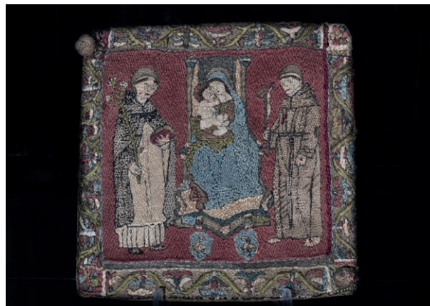
Fig. 9, Casa della beata Osanna Andreasi, Mantova, busta ricamata della fine del Quattrocento

anche di riprodurre l'abito esattamente com'era 17 . Così oggi, accanto a quello originale, frammentario, si può vedere la ricostruzione perfetta, collocata su un manichino che rispecchia le misure di Osanna quando, adolescente di circa sedici anni, l'aveva portato (fig. 8).