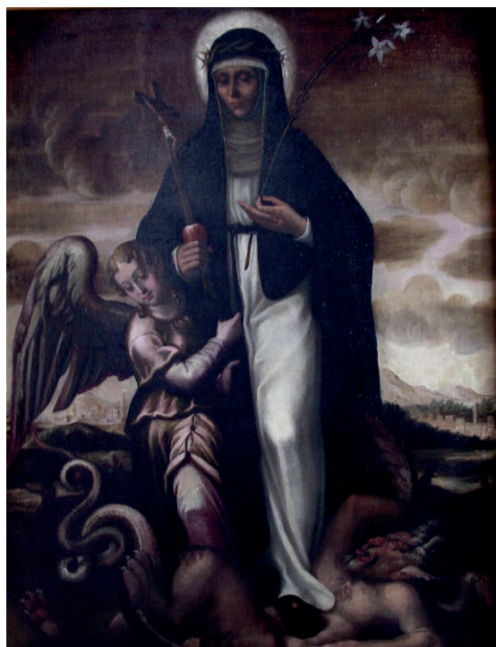
Fig.11, Casa della beata Osanna Andreasi, Mantova, dipinto del tardo Cinquecento con la Beata Osanna Andreasi con in mano il giglio e il cuore trafitto dal crocifisso, in atto di calpestare il diavolo e affiancata da un angelo

mantovani, che raffigura Osanna Andreasi con in mano il giglio e il cuore trafitto dal crocifisso, in atto di calpestare il diavolo e affiancata da un angelo (fig.11), secondo la consueta iconografia 22 . La tela, di discreta qualità – un tempo nella cappellina (o oratorio), dove ora è sostituita da una copia fotografica –, si trova appesa in una camera, adiacente alla stanza-museo, dove si conservano altri quadri con effigi di santi domenicani.