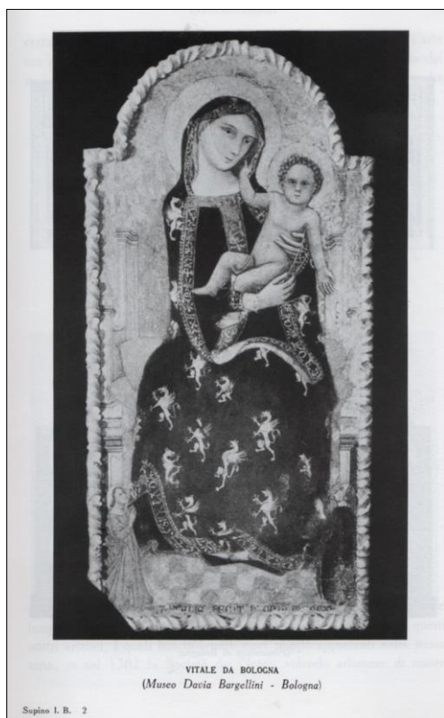
Fig. 2, La foto della Madonna dei Denti di Vitale da Bologna del Museo Davia Bargellini pubblicata in I.B. Supino, L'arte nelle chiese di Bologna. Secoli VIII-XIV , Bologna 1932