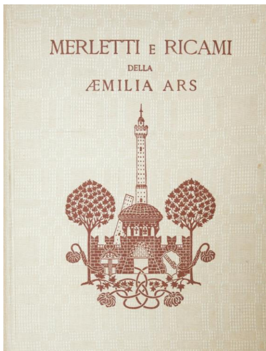
Fig. 10, Copertina del volume Merletti e ricami della Aemilia Ars , Milano, Casa Editrice d'arte Bestetti e Tumminelli, 1929