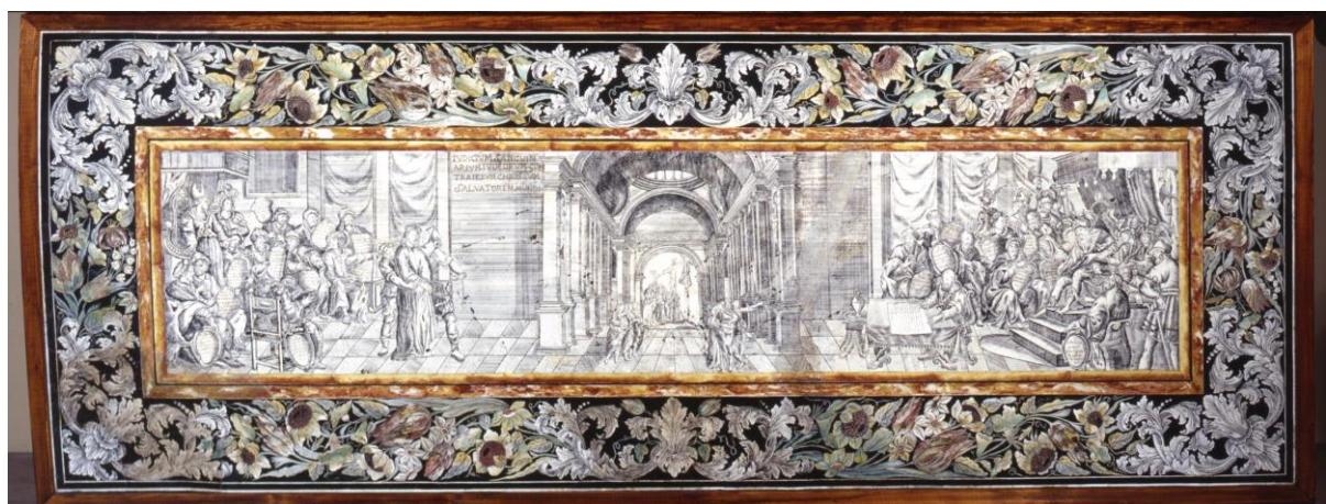
Fig. 8, Manifattura emiliana, Paliotto , scagliola dipinta, XVIII secolo, Museo Davia Bargellini