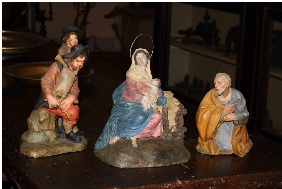
Fig. 11, Scultori bolognesi, Presepe composto da Madonna col Bambino, San Giuseppe e zampognari , terracotta dipinta, fine XVIII - inizio XIX secolo, Museo Davia Bargellini