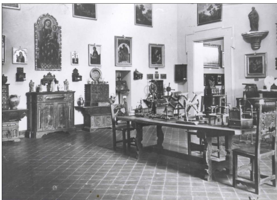
Fig. 1, La sala 1 del Museo Davia Bargellini nel 1924