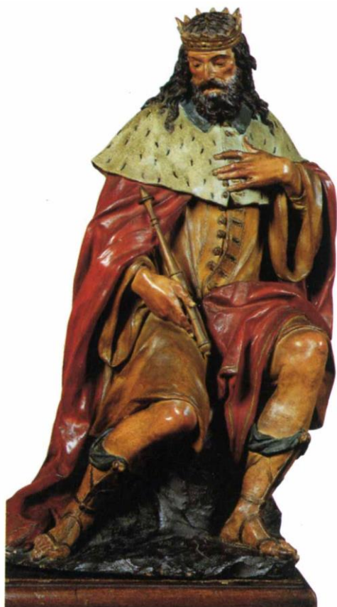
Fig. 12, Angelo Piò, Re David , terracotta dipinta, prima metà del XVIII secolo, Museo Davia Bargellini