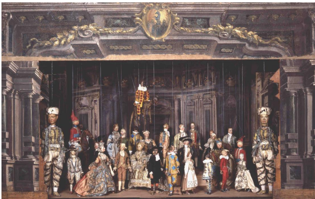
Fig. 4, Manifatture veneziane e scenografie di ambito bolognese, Teatrino delle marionette , metà del XVIII secolo, Museo Davia Bargellini