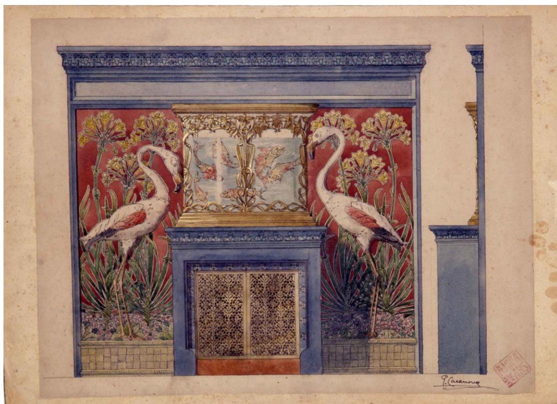
Fig. 9, Achille Casanova, Rivestimento in ceramica di un camino della Rocchetta Mattei a Riola di Vergato (BO) , disegno su carta a inchiostro e acquerelli, inizio XX secolo, Museo Davia Bargellini