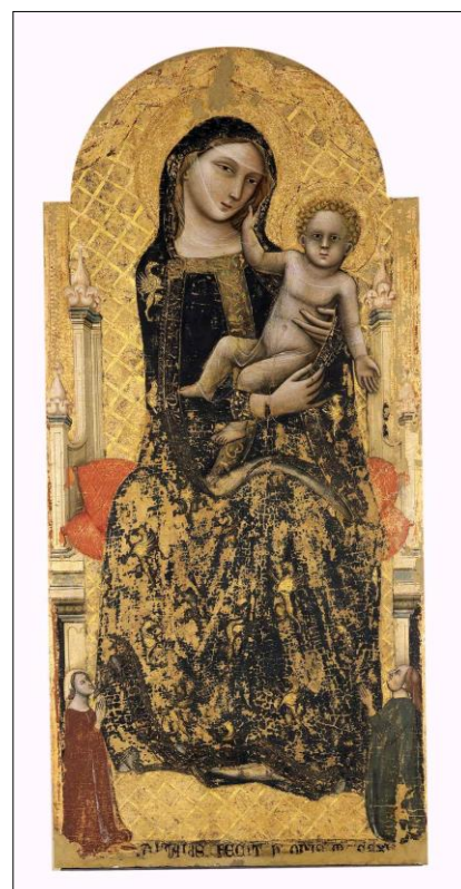
Fig. 3, Vitale da Bologna, Madonna dei Denti , 1345, tempera su tavola, Museo Davia Bargellini, come appare ora dopo il restauro degli anni ottanta del XX secolo