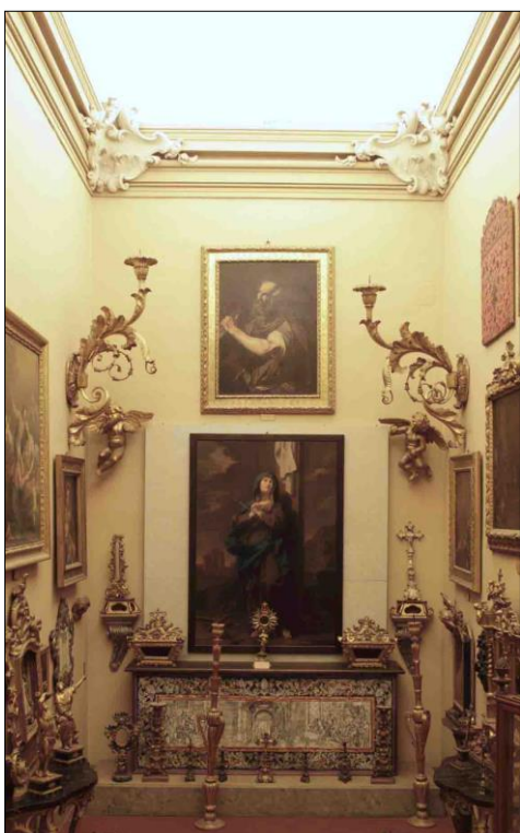
Fig. 5, Manifattura emiliana, Torchiere , legno intagliato e dorato, XVIII secolo, Museo Davia Bargellini