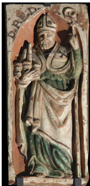
Fig. 6, Plastificatore bolognese, Targa devozionale con San Petronio , gesso dipinto, XVII-XVIII secolo, Museo Davia Bargellini